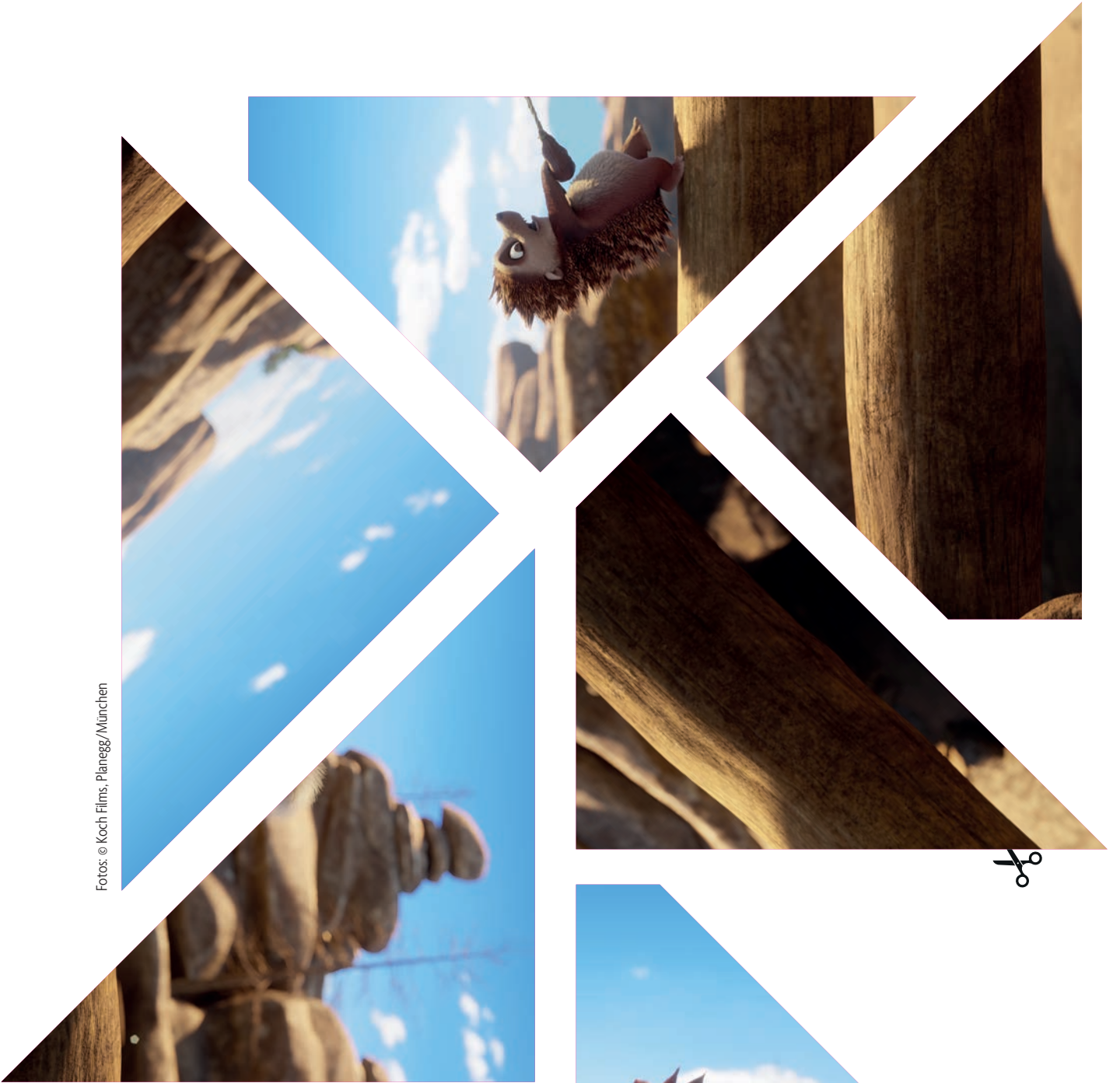
Filmbild-Puzzle zum Film LATTE IGEL UND DER MAGISCHE WASSERSTEIN Seite 3