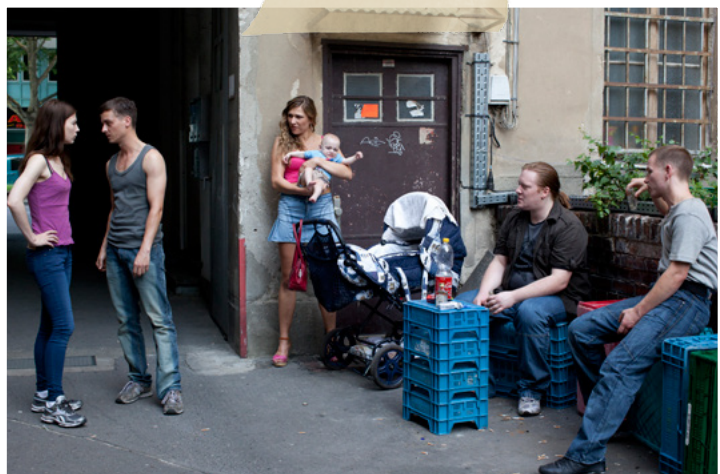
Ein typischer Hinterhof im Wedding (Szene aus dem Film WOYZECK)

Knapp die Hälfte der 80 000 Einwohner hat einen Migrationshintergrund, mit etwa 30 Prozent ist der Ausländeranteil deutlich höher als beispielsweise im Stadtteil Neukölln. Nicht der hohe Anteil an Migranten ist ein Problem, sondern die Tatsache, dass manche der im Wedding lebenden Ausländer schlecht integ-