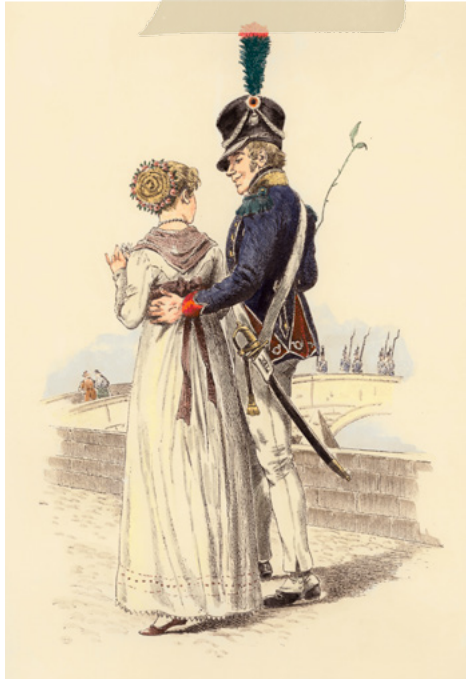
Ein Soldat der französischen Besatzungsmacht flirtet mit einer deutschen Frau (Beginn des 19. Jahrhunderts).