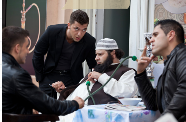
Tambourmajor (stehend) und Hauptmann (z.v.r.) in einer Szene aus dem Film