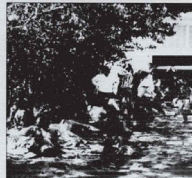
Vor dem „Sonnenblumenhaus“ in Rostock-Lichtenhagen sammeln sich täglich viele Sinti und Roma.

In Stoßzeiten, wie vor drei Wochen, können die acht mit den Erst-