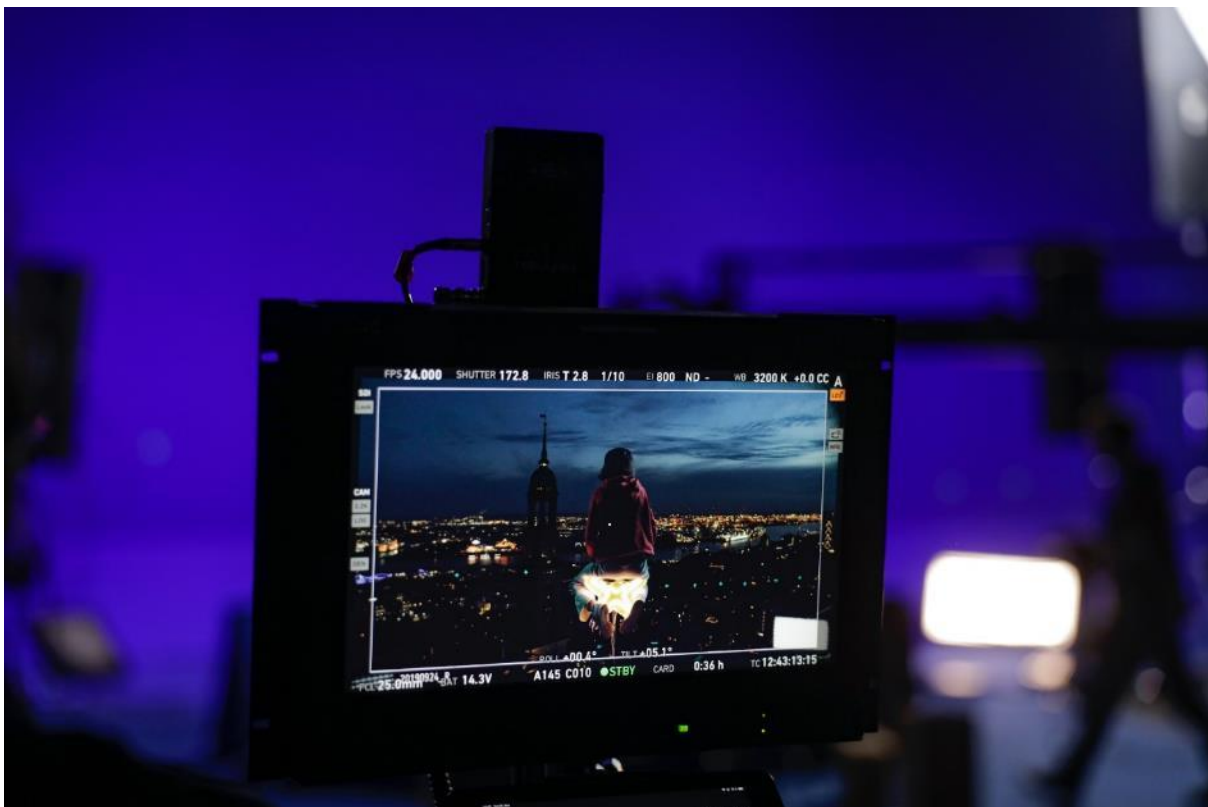
Per Computer wird die blaue Fläche durch die Stadt ersetzt,