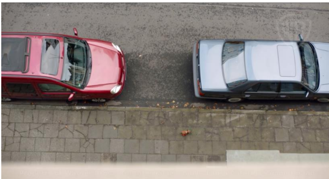
Szenenbild „Beschütz-mich-Hund von oben“

Mit den beiden Szenenbildern kann die Wirkung der unterschiedlichen Perspektiven erarbeitet werden. Die Klasse wird in zwei Gruppen oder mehrere Gruppen geteilt. Jede Gruppe bekommt entweder das Szenenbild „Beschütz-mich-Hund von oben“, oder das Szenenbild „Beschütz-mich-Hund von unten“ zur Betrachtung und beantwortet die Impulsfragen. Dann werden die Fotos getauscht und wieder die Impulsfragen beantwortet.