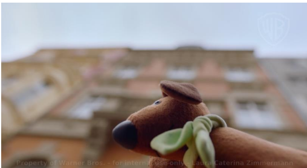
Szenenbild „Beschütz-mich-Hund von unten“